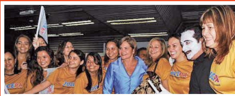
A Governadora Ana Júlia Carepa no meio dos colaboradores da JUCEPA.