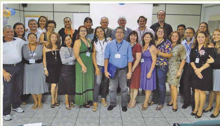
A foto registra o encerramento dos Encontros realizados no auditório da JUCEPA.

uma mesa redonda que abordou as seguintes temáticas: